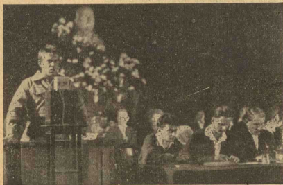
Genosse Kossarew, Sekretär des LKJV. der Sowjetunion, eröffnet den 5. Weltkongreß der KJL.

Der sozialdemokratische Pressedienst schreibt vom „Ge- sindel“ zwischen 16—19 Jahre, das eine ernste Gefahr für den Staat bedeutet. Diese widerliche Hetze soll ablenken von dem