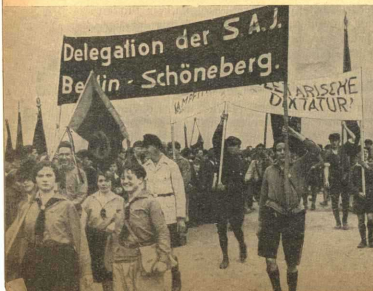
Die revolutionäre Einheitsfront der Jungarbeiter, das ist der Ausweg! SAJ-Mitglieder demonstrieren mit dem revolutionären Jungproletariat auf dem Reichsjugendtag in Leipzig, Ostern 1930

Vor dem Betrieb sammelten sich 200 Lehrlinge, die zum Streik entschlossen waren. Die in der Lehrwerkstatt beschäftigten Nazis bildeten darauf einen Sturmtrupp und holten 40 Lehrlinge in den Betrieb hinein.