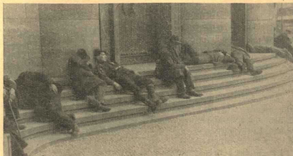
Obdachlose Jungarbeiter vor der Volksbühne in Berlin

Ein 17jähriger Jungarbeiter aus Buer-Hassel (Rheinland) warf sich am Bahnübergang in der Morber Straße vor einen Personenzug. Dem Unglücklichen wurde hierbei vollständig der Kopf vom Rumpf getrennt.